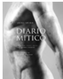
★ Diario Mitico , fotografie di Luigi Spina, testi di Philippe Daverio e Giovanni Fiorentino, 5 Continents Editions 2017, 160 pagine, 59 €. Formato: 27,5x34 cm