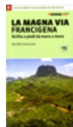
A PIEDI SULL'ISOLA ★ La Magna Via Francigena , di Davide Comunale, Terre di Mezzo Editore 2017, 96 pagine, 12 €.

Da Palermo ad Agrigento, 180 chilometri sulla regina delle antiche vie dell'isola, da poco nuovamente tracciata a cura degli Amici dei Cammini Francigeni di Sicilia. Una guida agile e ricca di informazioni sulle nove tappe del percorso, tra celebri monumenti e paesaggi da scoprire.