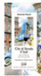
ANTICHI SAPORI ★ Cibi di strada. Il Sud , di Stanislao Porzio, Guido Tommasi Editore 2017, 208 pagine, 15 €.

Da Palermo ad Agrigento, 180 chilometri sulla regina delle antiche vie dell'isola, da poco nuovamente tracciata a cura degli Amici dei Cammini Francigeni di Sicilia. Una guida agile e ricca di informazioni sulle nove tappe del percorso, tra celebri monumenti e paesaggi da scoprire.